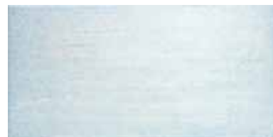
ANTIC AZUL 25x50