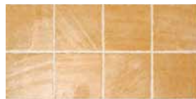
ANTIC COTTO REL. 25x50