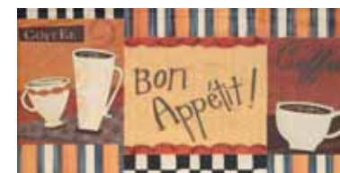
DECOR. ANTIC COCINA 2