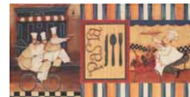
DECOR. ANTIC COCINA 1 25x50