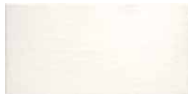
ANTIC BLANCO 25x50