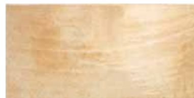
ANTIC COTTO 25x50