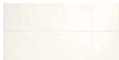
ANTIC BLANCO REL. 25x50